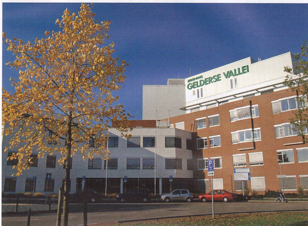
De proef in Ziekenhuis Gelderse Vallei duurde vijf maanden.

tijd wordt vers bereid in de ziekenhuiskeuken. Maximaal drie kwartier later krijgt de patiënt het geserveerd in een gezellige lounge. Patiënten in een mindere conditie kunnen hun maaltijd op de kamer of in bed gebruiken. Een glaasje wijn erbij tegen een eigen bijdrage, is, mits medisch verantwoord, geen enkel probleem.