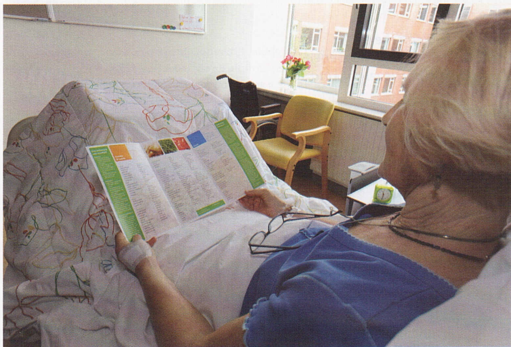
Het is de bedoeling dat de patiënt de maaltijd in de lounge nuttigt.

Zo gebeurde het dat van april tot augustus 2010 een deel van de patiënten van de Gelderse Vallei baas over eigen bord werd in At Your Request. In dit concept bestellen patiënten van zeven uur 's morgens tot acht uur 's avonds maaltijden van een menukaart die qua omvang niet onderdoet voor die van een restaurant. De maal-