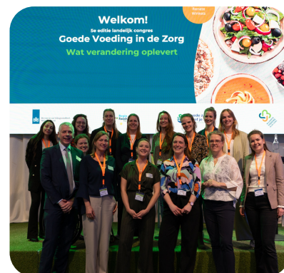
Team Alliantie Voeding in de Zorg