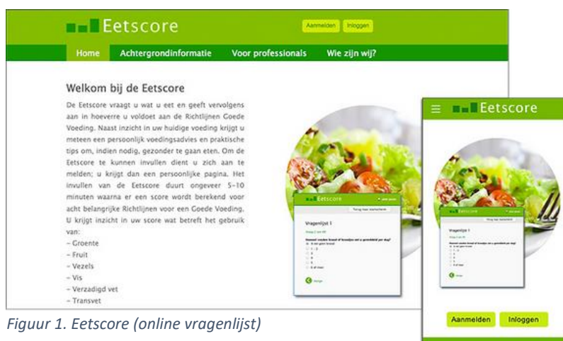
Figuur 1. Eetscore (online vragenlijst)

De Eetscore, een korte online vragenlijst, is ontworpen om de voedingskwaliteit te beoordelen en gepersonaliseerde adviezen te geven. Een eerder onderzoek liet zien dat enkel persoonlijk voedingsadvies van de Eetscore niet voldoende is om de voedingskwaliteit van patiënten met hart- en vaatziekten te verbeteren. Een onderzoek bij patiënten met ontstekingen aan de darm liet echter zien dat alleen de Eetscore wél effectief was.